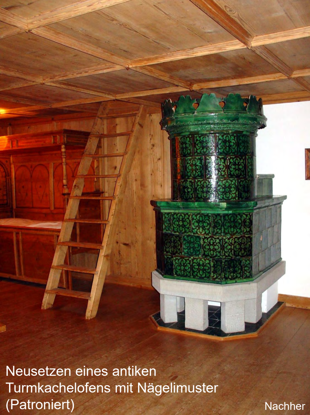
Neusetzen eines antiken Turmkachelofens mit Nägelmuster (Patroniert)