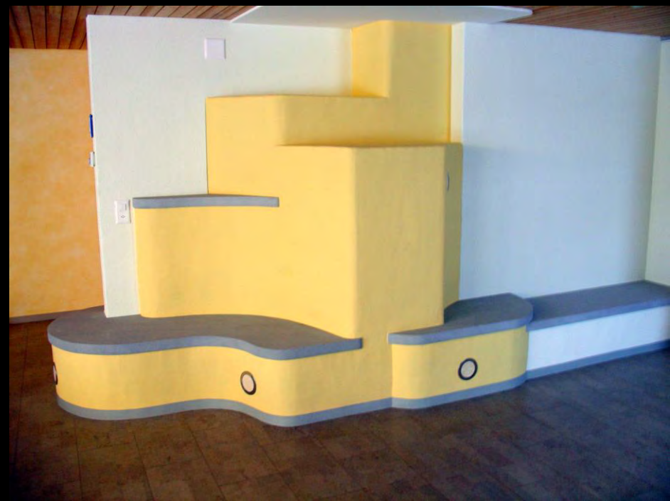
Speicherofen mit Sitzbank