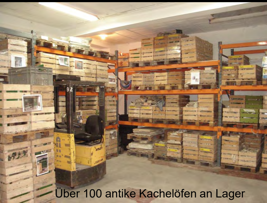
Über 100 antike Kachelöfen an Lager