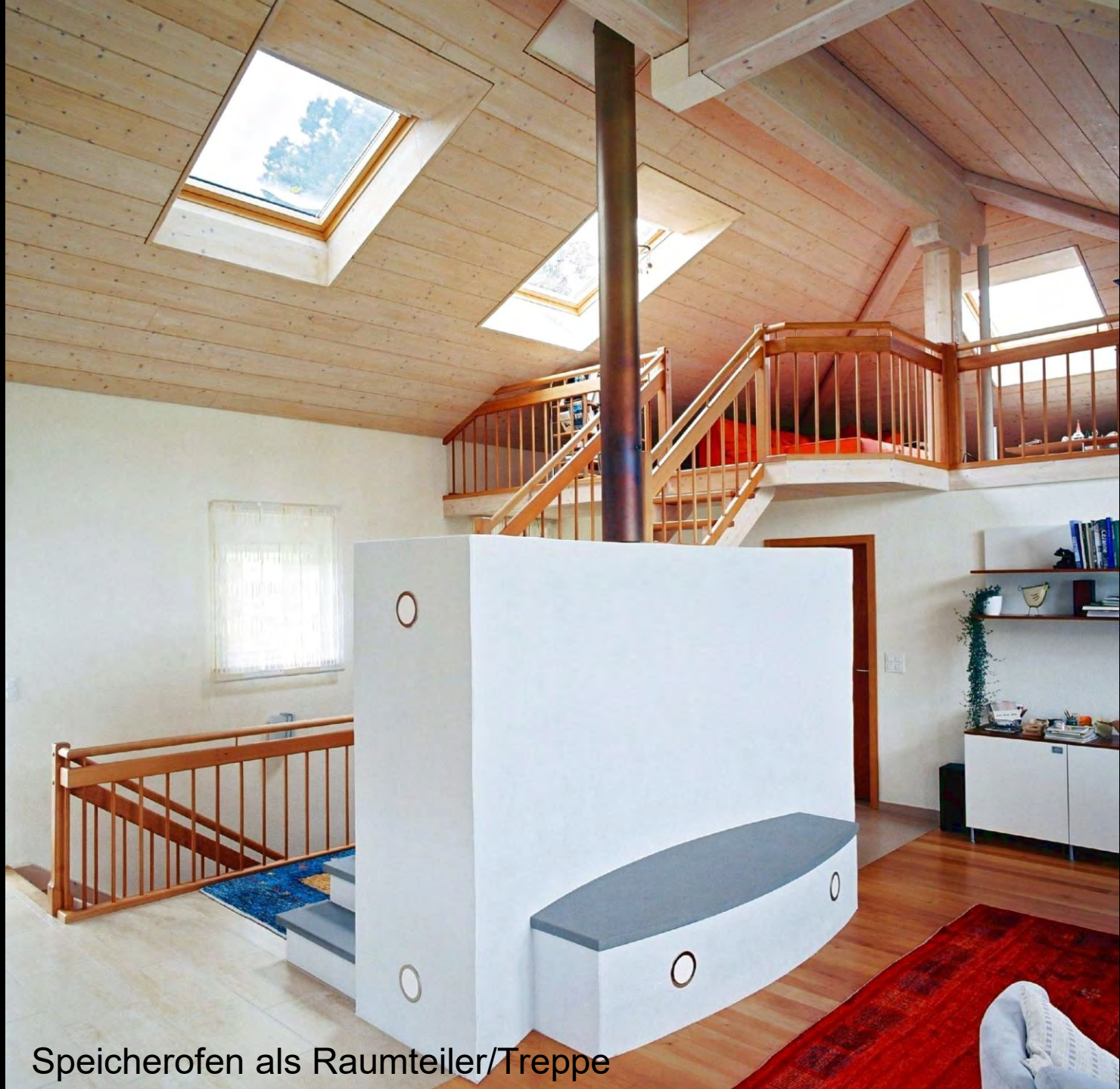
Speicherofen als Raumteiler/Treppe