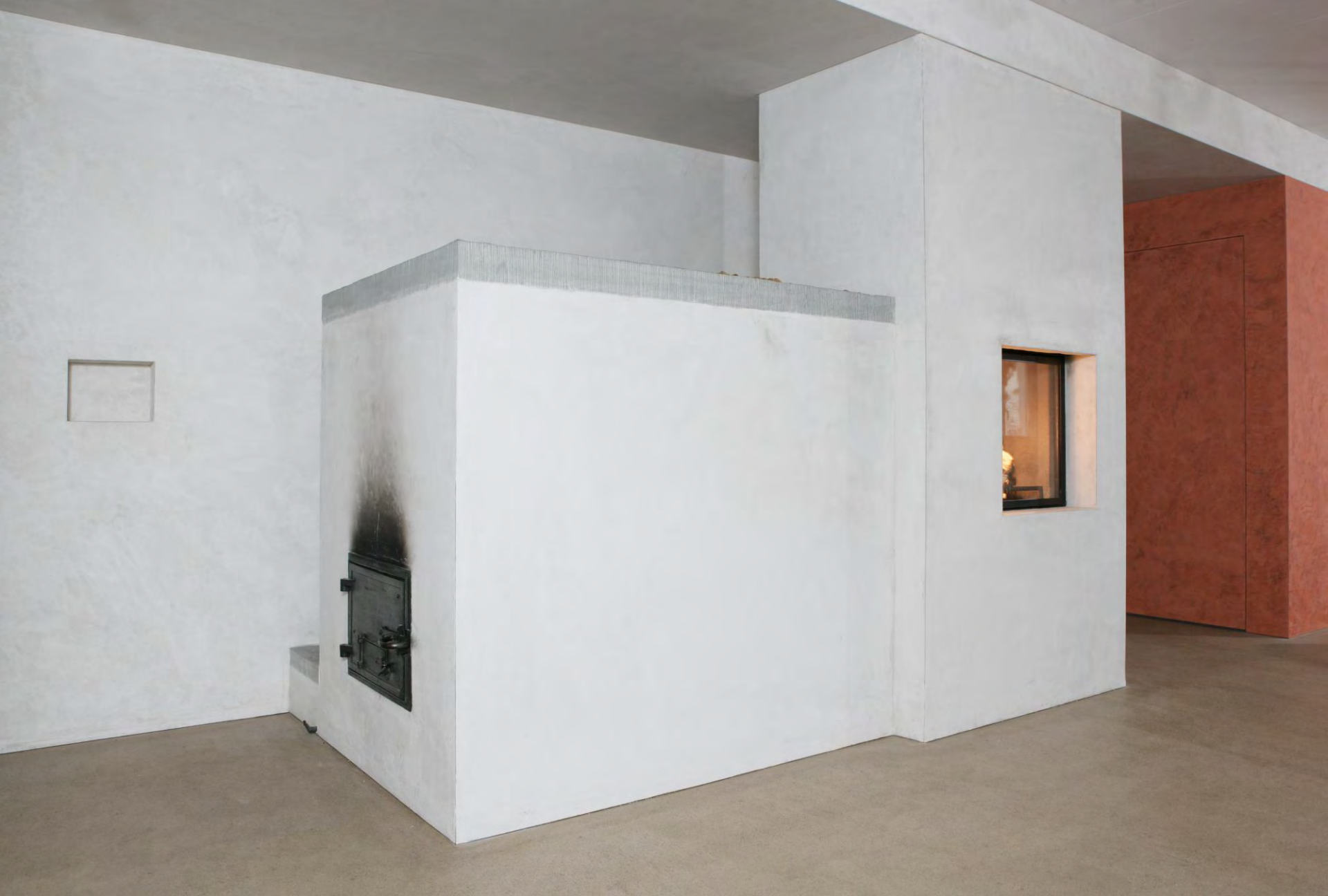
Speicherofen mit Zentralheizungseinsatz, kombiniert mit einer Feuerstelle