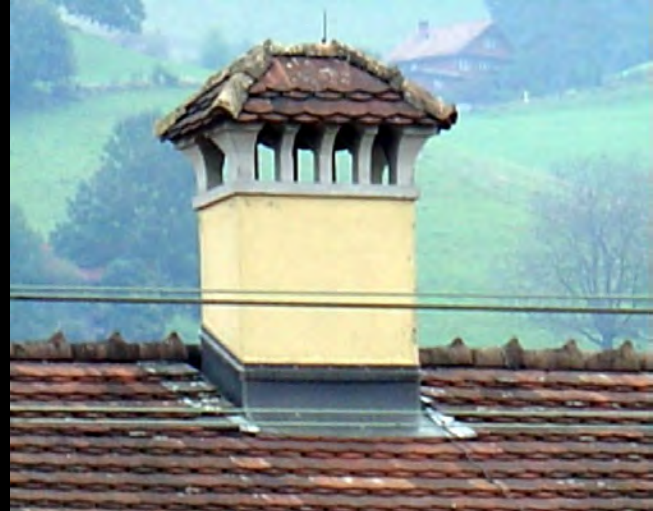
Kaminhüte aus allen Zeit- und Stilepochen