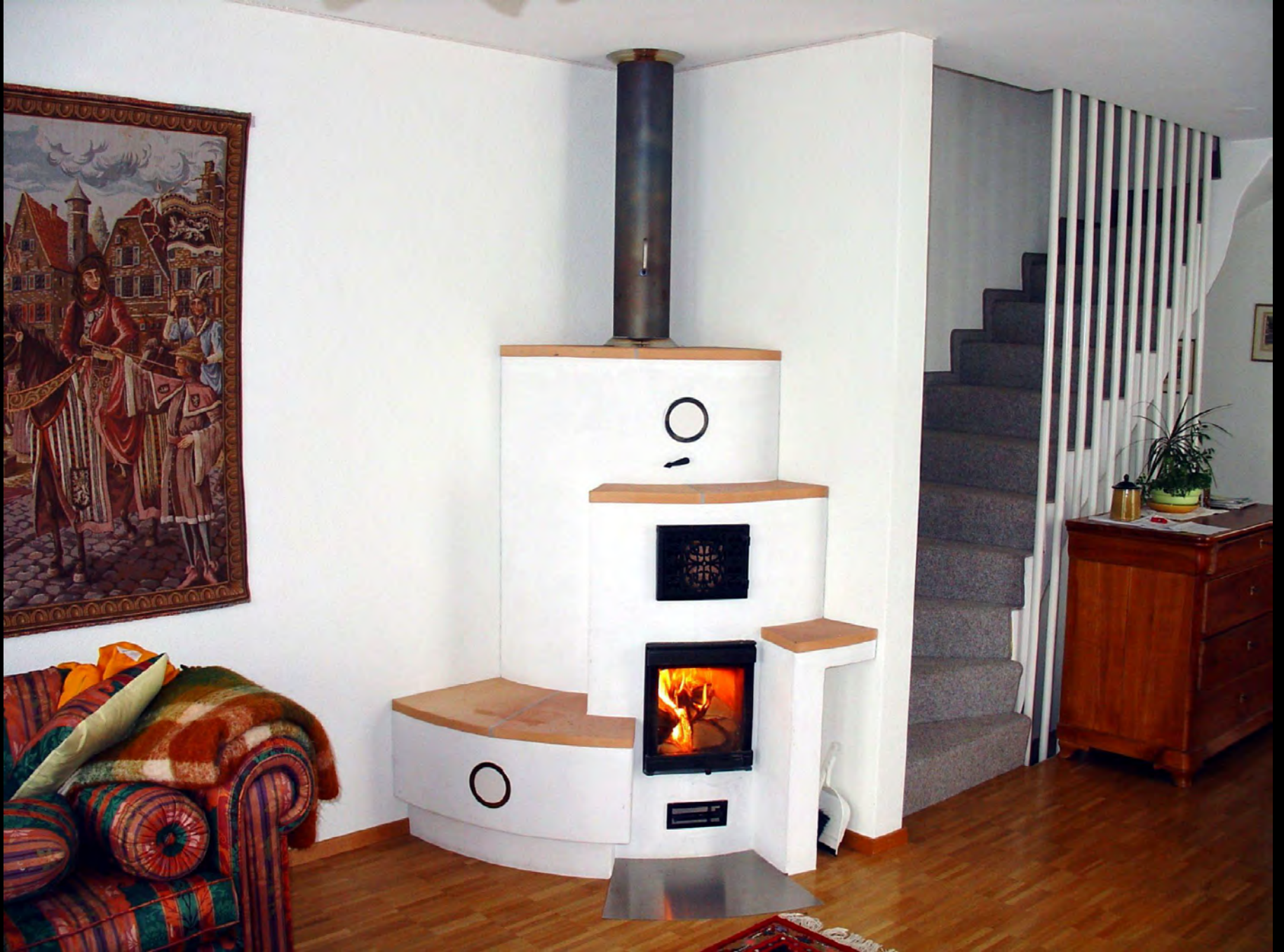
Kleinspeicherofen mit Sitzbank