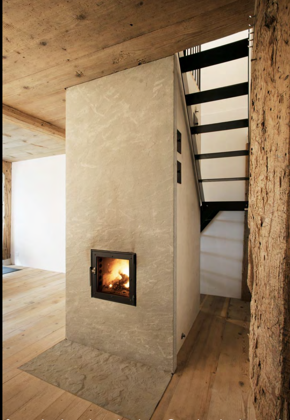
Speicherofen mit einer bruchrohen Sandsteinplatte als Front