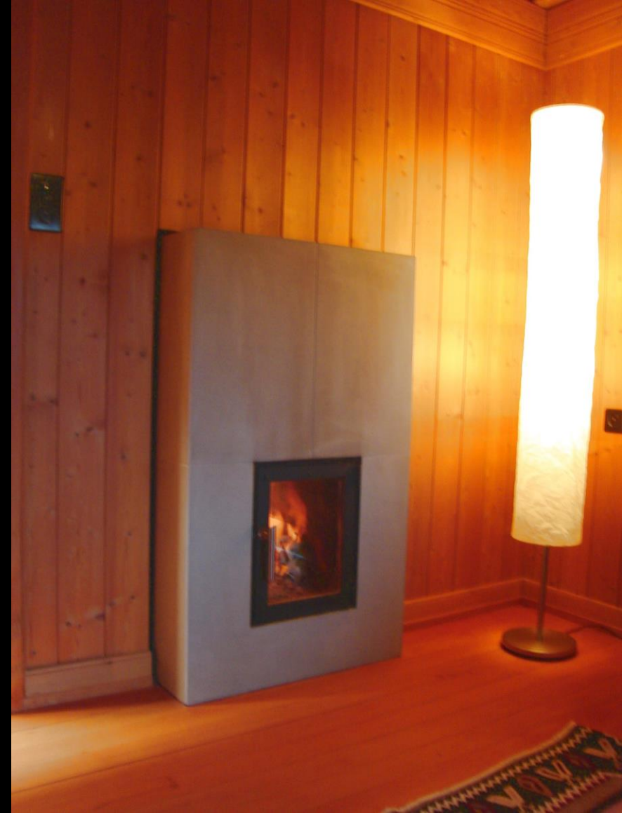
Kleinspeicherofen mit Sandsteinaussenhülle zwei Feuerüren