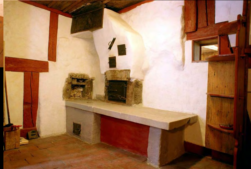
Speicherofen in antiker Form