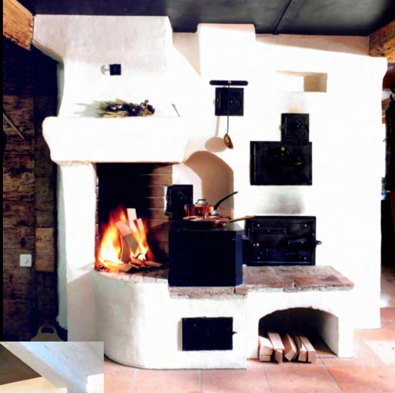
Diverse Feuerstellen mit Holzherden