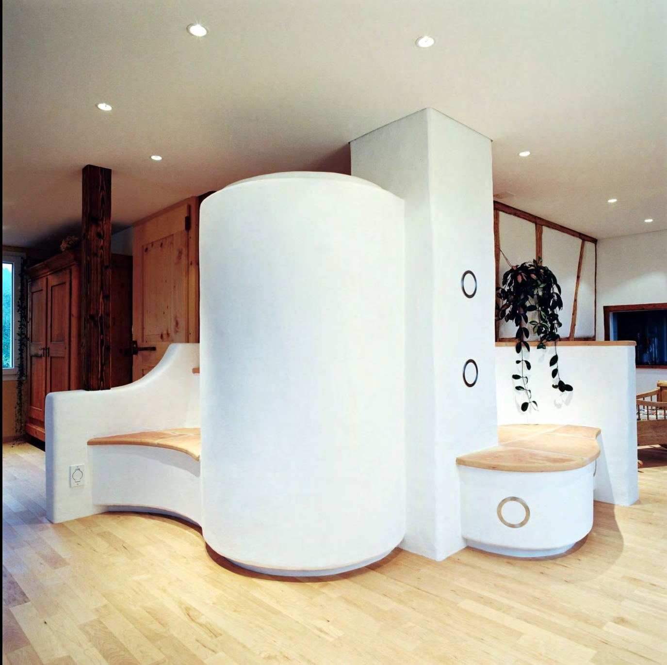
Speicherofen mit Sitzbänken