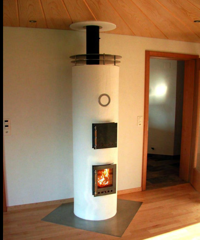
Runde und halbrunde Kleinspeicheröfen