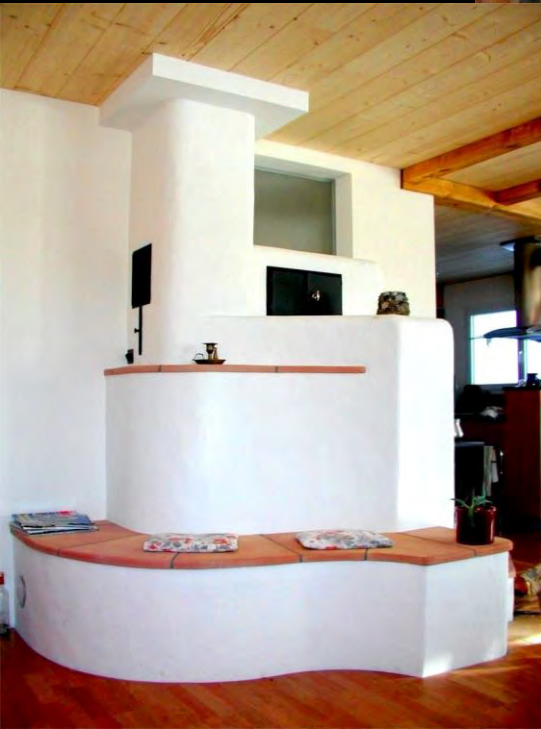
Speicherofen mit Sitzbank, kleiner Holzkochherd