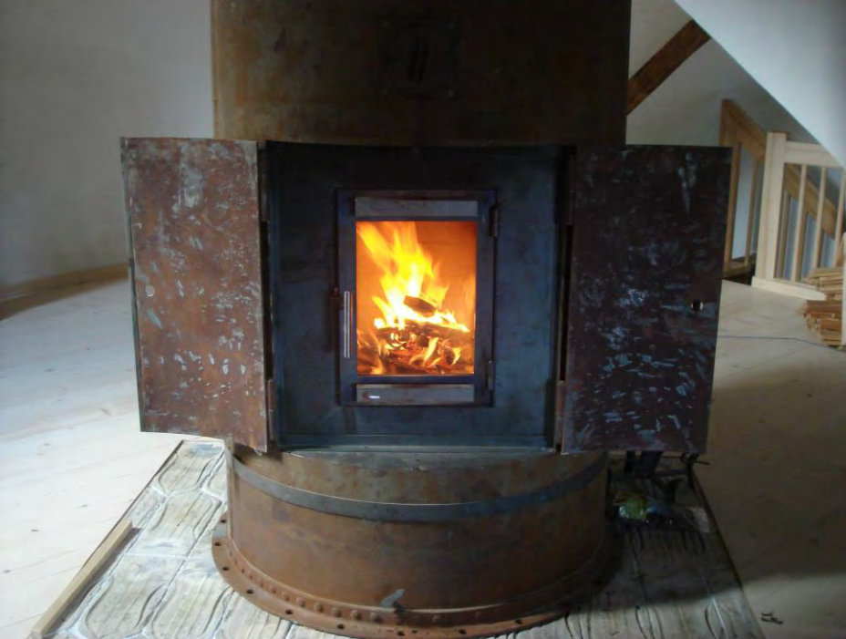
Antikes Wasserdruckrohr als Aussenhülle für einen Speicherofen