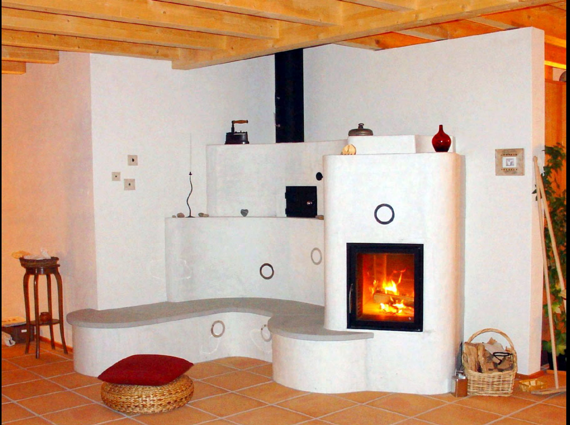
Speicherofen mit Sitzbank