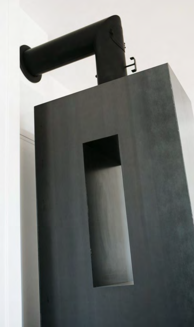
Kleinspeicherofen „Chalybis“, Schwarzblechaussenhülle 4mm, Innenausbau mit Schamotte