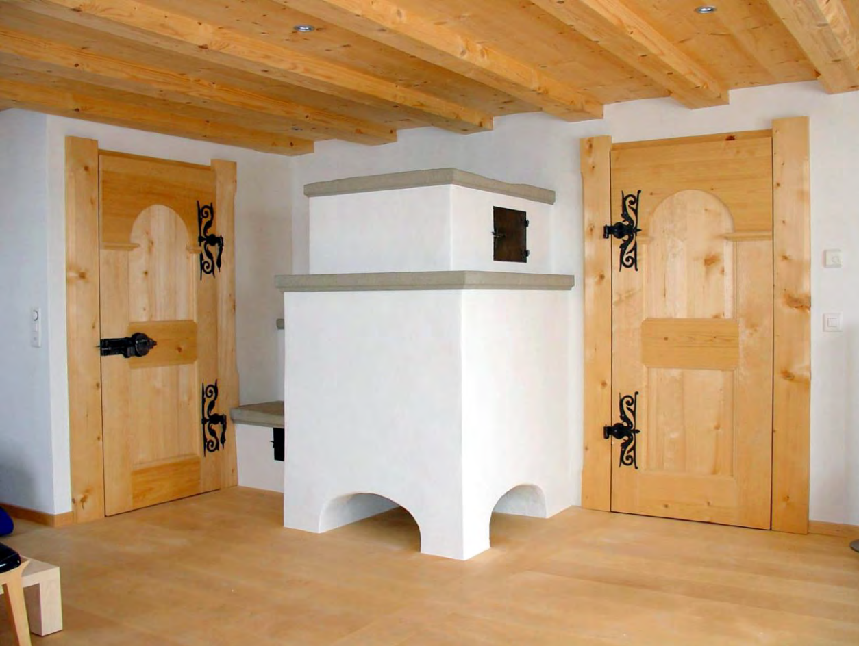
Speicherofen in antiker Form