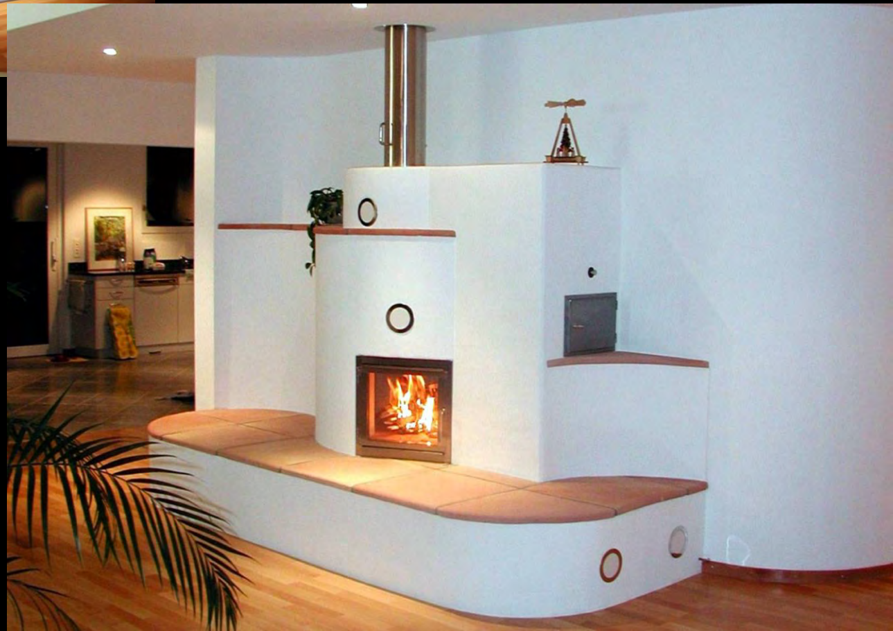
Speicherofen mit Sitzbank