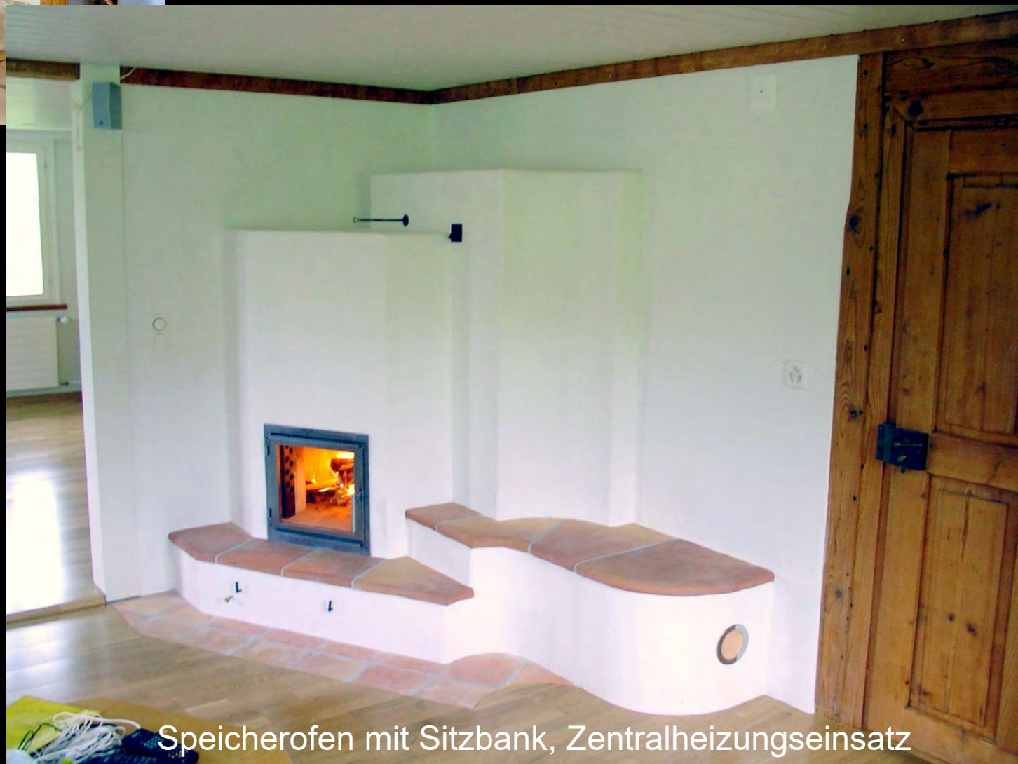
Speicherofen mit Sitzbank, Zentralheizungseinsatz