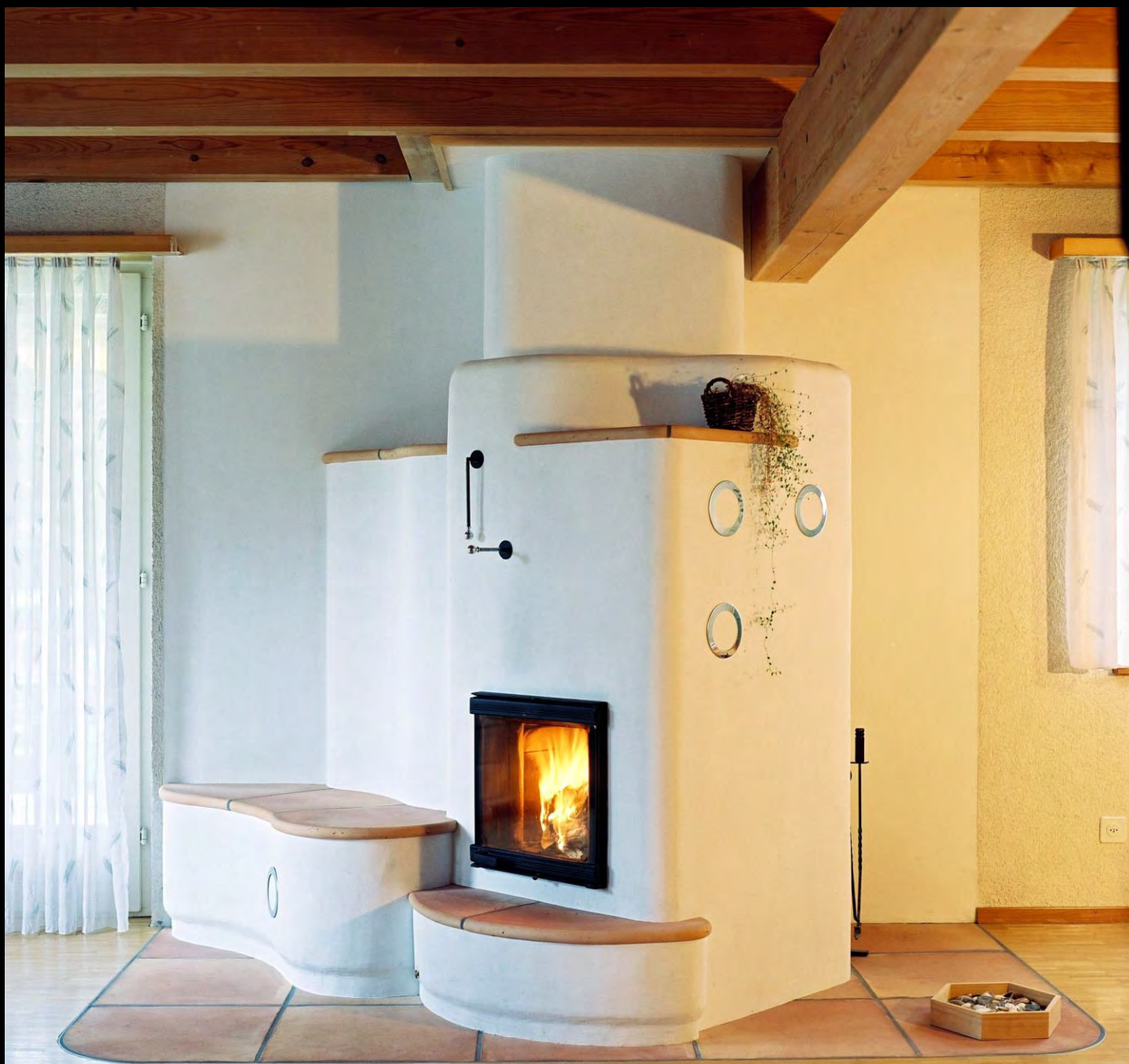
Speicherofen mit Sitzbank