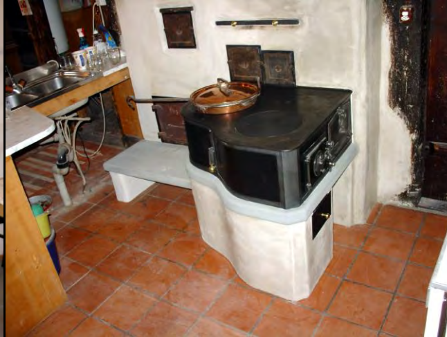
Antike und neue Holzkochherde in allen Variationen