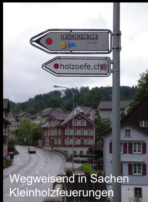
Wegweisend in Sachen Kleinholzfeuerungen