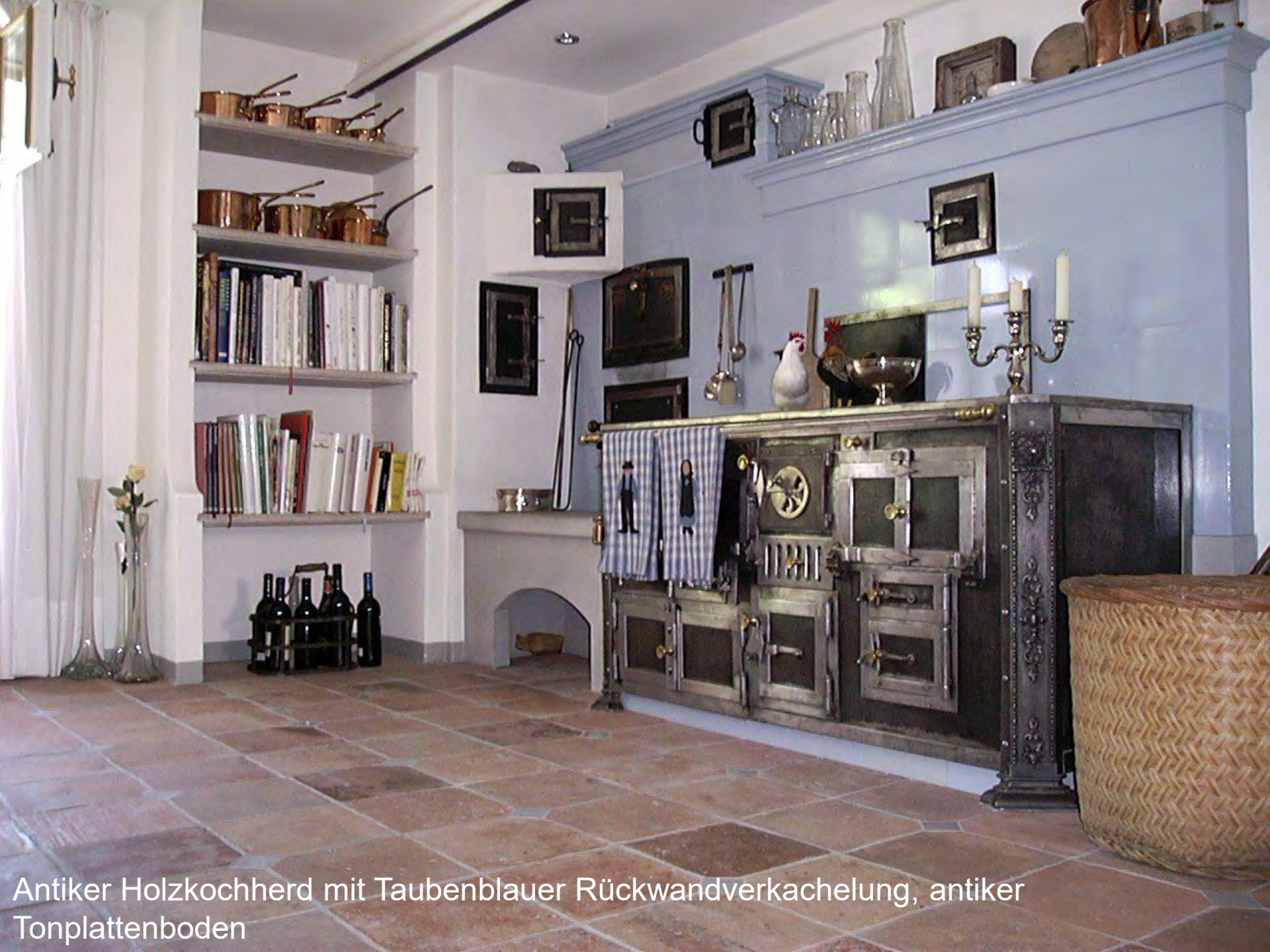
Antiker Holzkochherd mit Taubenblauer Rückwandverkachelung, antiker Tonplattenboden