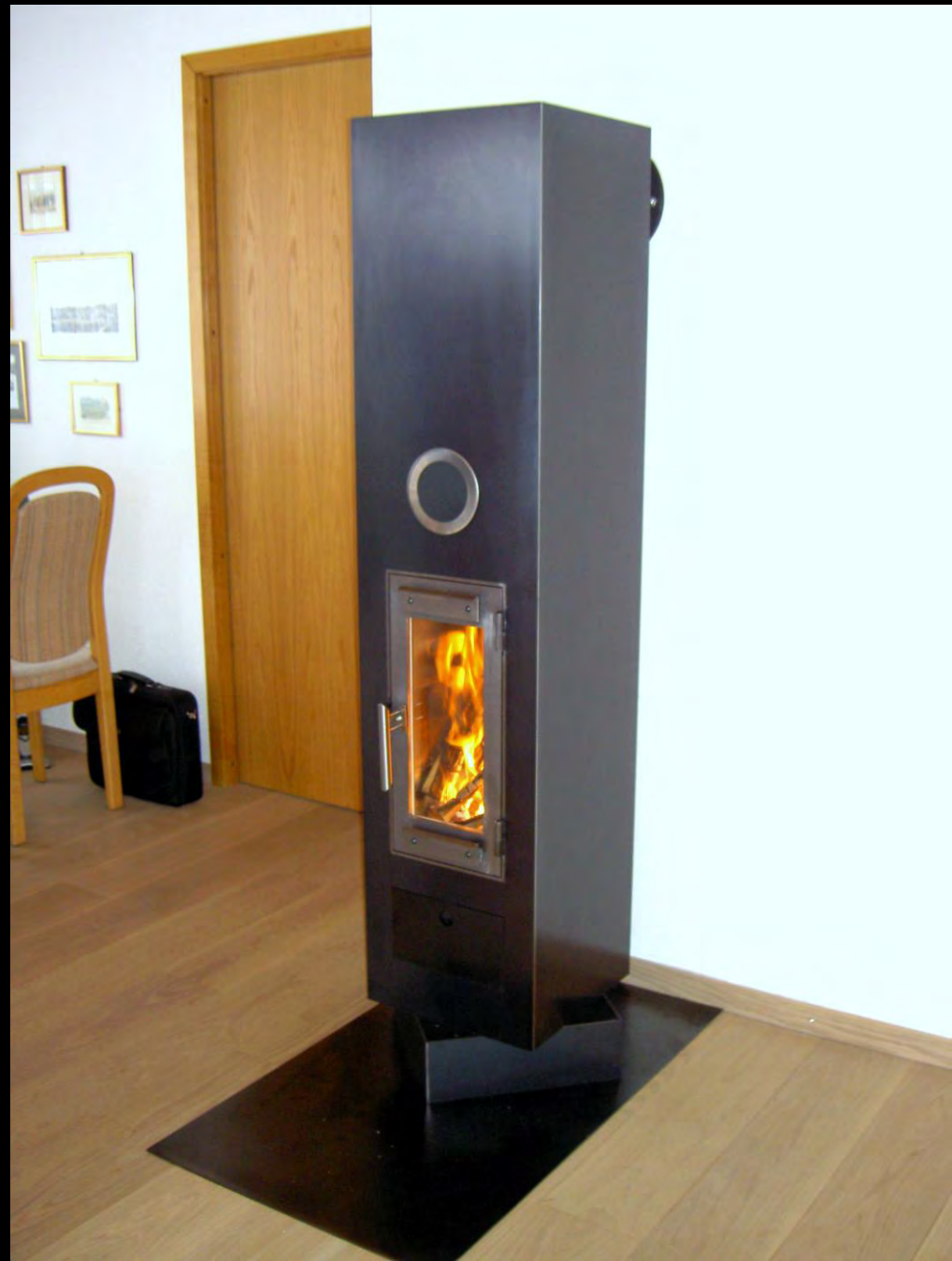
Kleinspeicherofen „Turris“, Schwarzblechaussenhülle 4mm, Innenausbau mit Schamotte