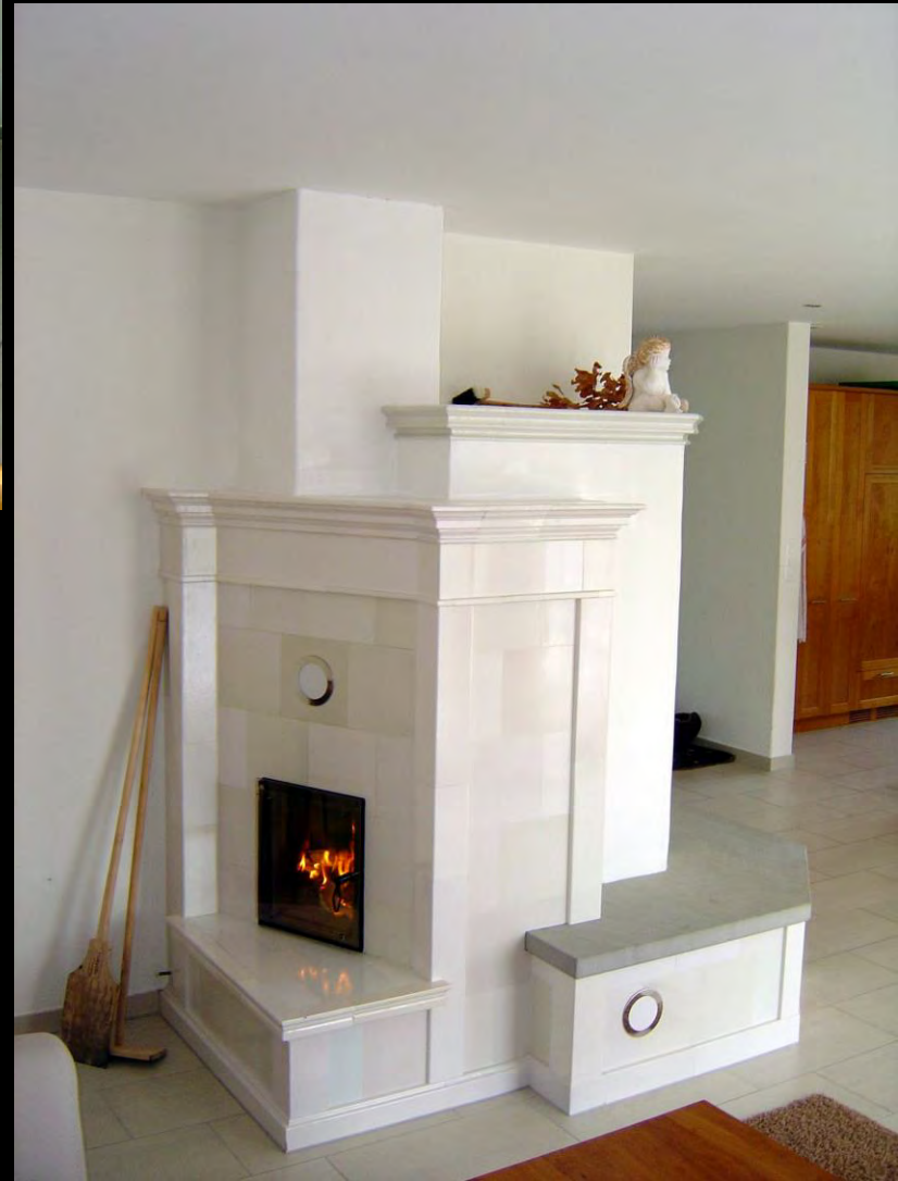
Moderner Speicherofen Kacheln/Verputz kombiniert. Antike Kacheln mit Schmelzglasur