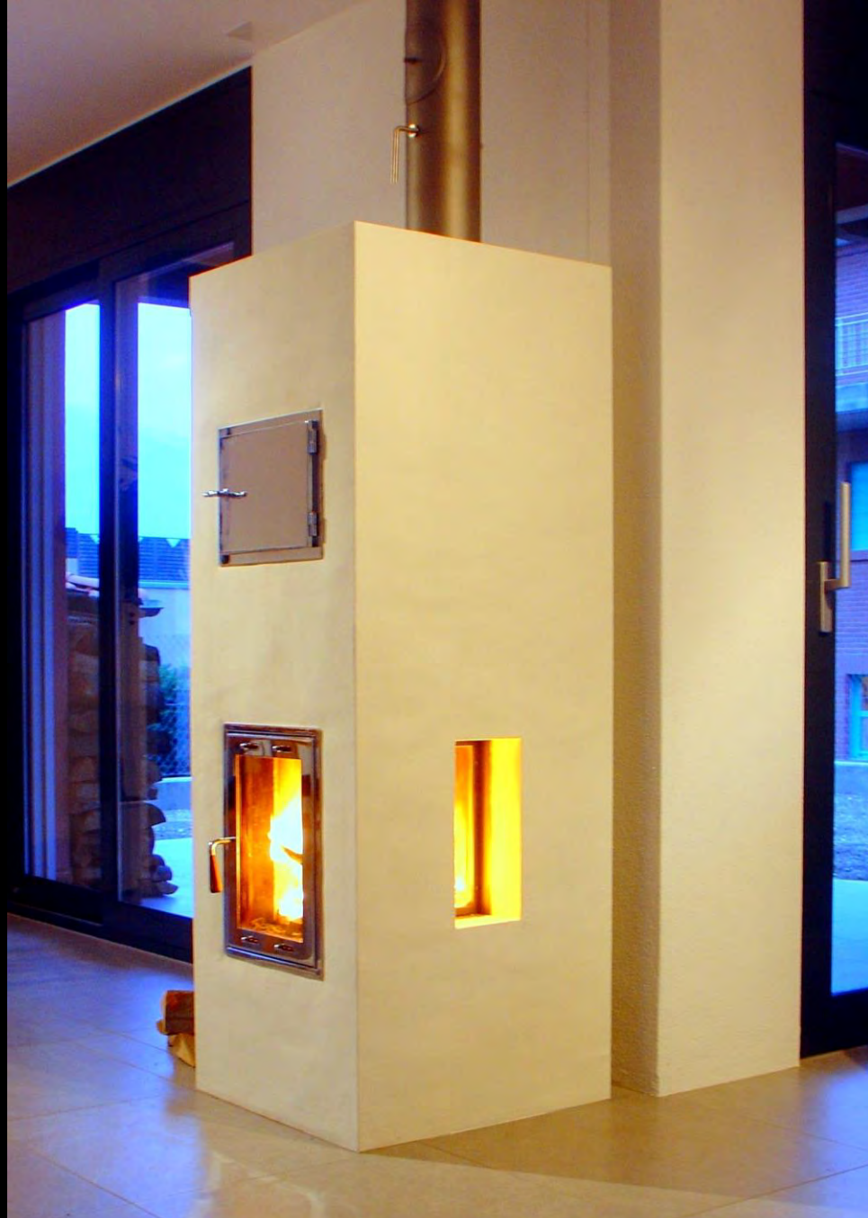
Kleinspeicherofen mit zusätzlichem Sichtfenster